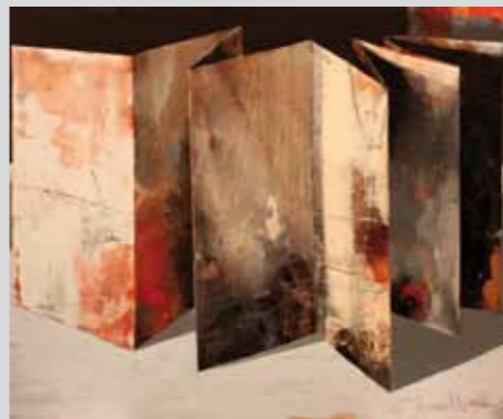
Leporello, 2010 Mischtechnik/Leinwand 160 x 200 cm

Thomas Kleemann beherrscht die Farbe, er weiß mit Pigmenten und Materialien geradezu virtuos umzugehen. Trotz des konstanten Motivs der Linie, die aus Relieftiefe entsteht, wird die Bildsprache kontinuierlich weiterentwickelt. Ob in seinen sinnlichen Rottönen oder in der vornehmen, zurückhaltenden Weißgrauskala, die Bilder fesseln, ohne dass ein Motiv oder eine Erzählung dafür verantwortlich gemacht werden kann.