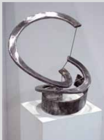
Zwei Spiralen, auf- und absteigend übereinander, 2010, Stahl, 35 x 25 x 25 cm

Matthias Will studierte Bildhauerei an der Städelschule bei Michael Croissant. Er versteht es, dem bildhauerischen Grundproblem eine Form zu geben. Aus dem Material Stahl schafft er Skulpturen, die von den Polen Schwere-Leichtigkeit und Stabilität-Instabilität sprechen. Damit geht er von geometrischen Formen, Würfel, Kreis, Quader, Kugel aus, die er teilt und durch Drahtseile mit ihrem Gegenstück verbindet.