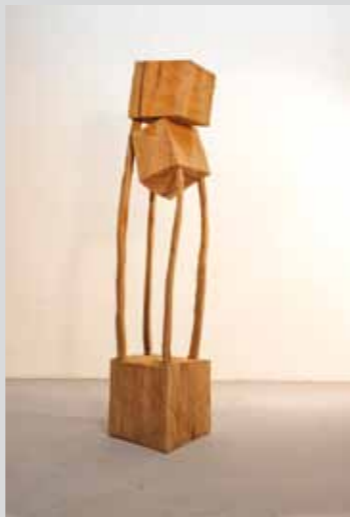
o.T., 2007, Platane, 207 x 42 x 44 cm

Der Holzbildhauer Armin Göhringer bearbeitet kompakte Stämme mit der Kettensäge. Dabei spürt er sensibel dem Charakter des Materials nach. Aus dem organischen Material sägt er kubische Formen heraus und ist dabei figurativ ohne figürlich zu sein. Die Kompaktheit des Materials reduziert er bis an die Grenze des Machbaren auf filigrane Trägerelemente und schafft damit Skulpturen, die den Betrachter durch ihre Spannung von Tragen und Stützen, Berühren und Distanz, Bewegung und Ruhe beeindrucken.