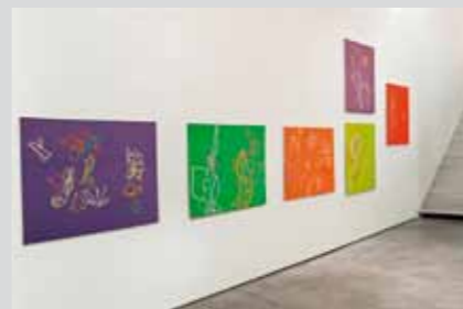
Aus der Serie Alphabet, 2010