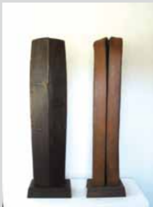
Idol II, 2009, Eisen geschweißt, 80 x 22 x 12 cm Rote Stele II, 2007, Eisen geschweißt, Farbe, 82 x 20 x 13 cm

Seit etwa zwei Jahren beschäftigt sich Helga Föhl mit dem Thema Stele. Es entstehen schlanke, aufragende Figurationen – Karyatiden, Obelisken, Idole in verschiedenen Variationen mit aufwendig bearbeiteten, ganz unterschiedlichen Oberflächen. Ihr Material: Eisen, geschweißt und geschliffen, poliert, brüniert oder farblich behandelt.