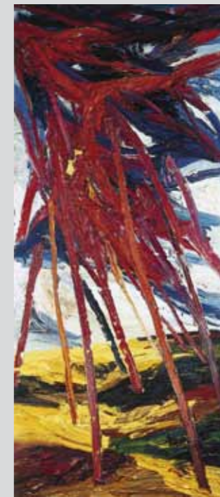
Land Energie, 2007, Öl/Leinwand, 195 x 85 cm

Harry Meyers Ölgemälde aus dem Zyklus „Land Energie“ stehen dem klassischen „Kosmos“-Begriff sehr nahe: Alle vier Elemente – das feurige Licht der Blitze, das Wasser des Gewitterregens, der tosende Sturm und die seiner Wucht ausgesetzte Erde – vereinigen sich zu Werken von großer Ausstrahlungskraft. Herausragende Bedeutung eignet hierbei dem Licht: Es ist schön an sich; und mit den Strahlen seines Glanzes, den es verschwendet und der dennoch unerschöpflich ist, vermehrt es diese Schönheit in der Sichtbarmachung aller Dinge – es geleitet, nach der Auffassung des Aristoteles, das bloß Mögliche zur Wirklichkeit. Licht-Energie in reiner Form