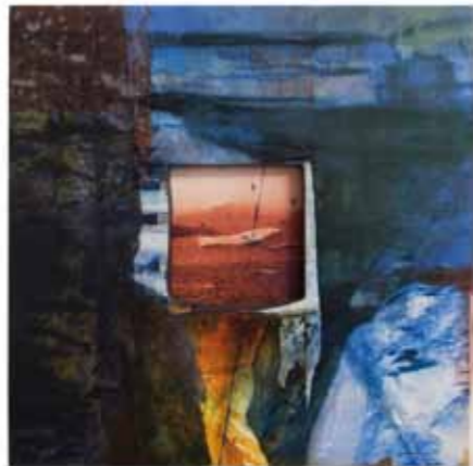
La solitud de l'illa, 2010, Acryl, Radierung und Digitalbild auf Leinwand und Japanpapier, Blei, 90 x 90 cm

Die Arbeiten kombinieren Malerei, Grafik, Lithographie, Plastik und es gibt zwei Schlüsselemente: Zweidimensionalität durch Malerei und Fotografie, Dreidimensionalität durch Eisen, Blei und Steine. In ein und derselben Arbeit sind Elemente der Kraft und der Poesie zu einer Koexistenz verwoben.