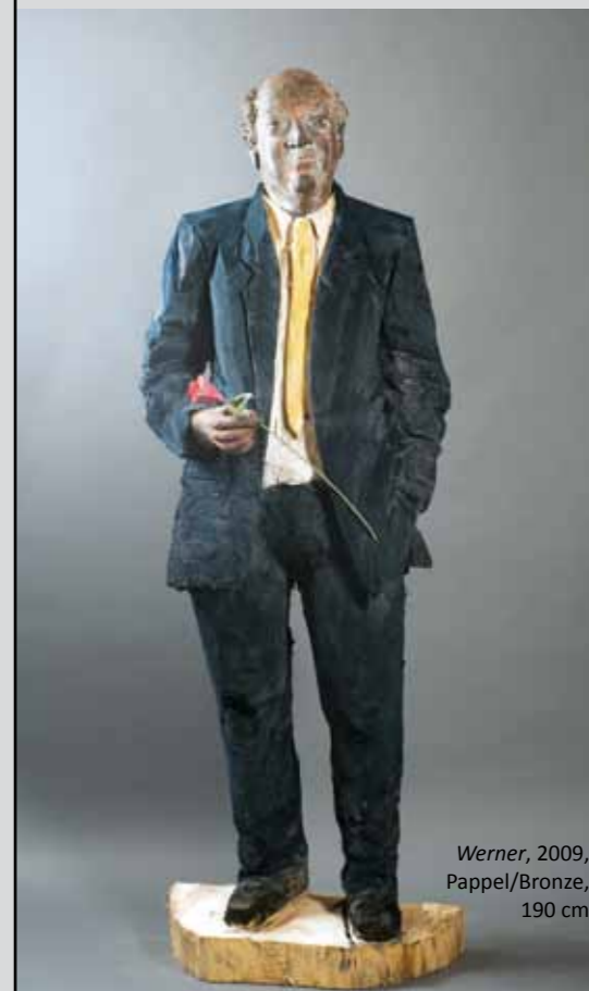
Werner, 2009, Pappel/Bronze, 190 cm

Der Holzbildhauer Clemens Heini legt Wert darauf, dass es sich bei seinen Figuren um ganz bestimmte Personen handelt. Dadurch sind sie weder beliebig noch austauschbar. Seine Skulpturen sind nach den Maßstäben des heutigen Schönheits-Ideals in keiner Weise „perfekt“. Dies macht sie umso reizvoller und spannender.