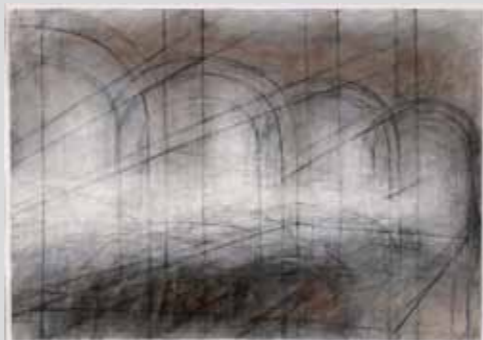
Raumstation-Fuhrpark, 2010, Mischtechnik/ Collage auf Papier, 43 x 61 cm

Im Zentrum des künstlerischen Schaffens von Sibylle Schlageter stehen architektonische Elemente und ihre Verspannung im Bildraum. Die Arbeiten leben von der Spannung zwischen dynamischer Zeichnung und verhaltener Farbgebung. Es entstehen fragile Raumentwürfe von großer Offenheit und Transparenz.