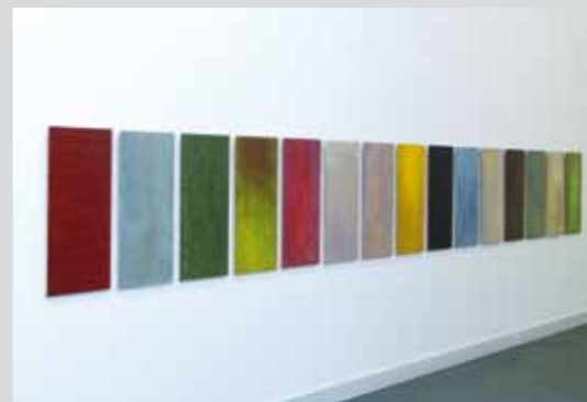
Blick in die Ausstellung im Landesmuseum Darmstadt, 2007