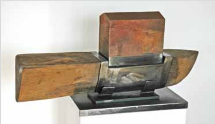
Hausboot I, 2010, Holz / Eisen / Papier, 114 x 70 x 22 cm (mit Sockel)

Bei Gerda Biers Arbeiten treffen wir oft auf ambivalente Aussagen. So auch in ihrer Arbeit „Hausboot“ 2010. Einer Plastik aus Holz, Eisen und Papier gefertigt, in der das Bedürfnis nach einer festen Verortung bei gleichzeitiger Ungebundenheit ihren Ausdruck findet.